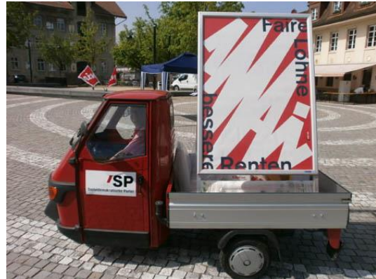
Speedy, zu besseren Zeiten