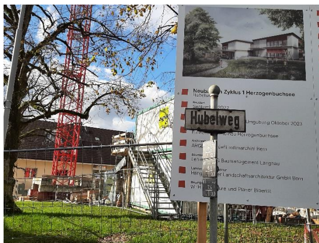
Bildlegende: Für den dringend benötigten Schulraum wäre eine Steuererhöhung notwendig (Bild Neubau Kindergarten Hubel)